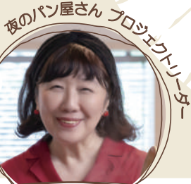
夜のパン屋さん プロジェクトリーダー