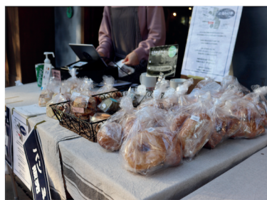
出張夜のパン屋さん